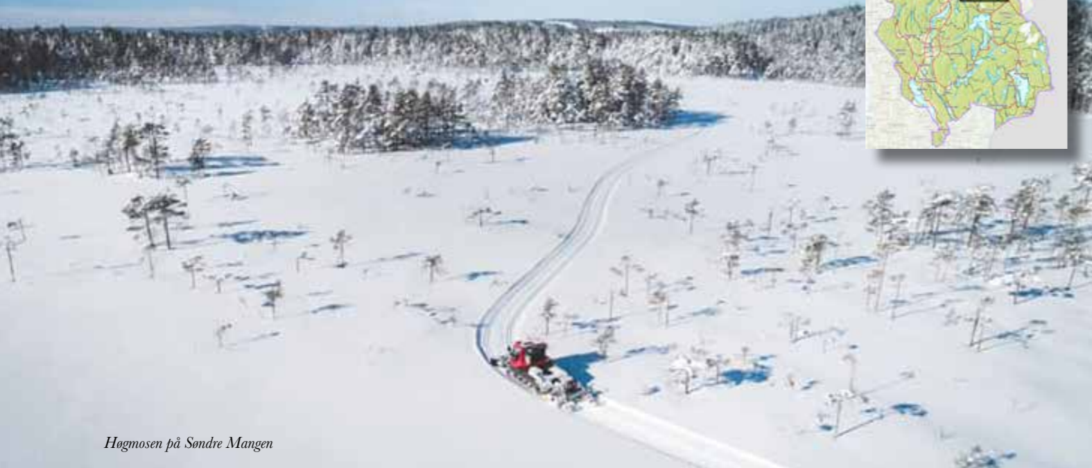
Høgmosen på Søndre Mangen

Sammen med et 20 talls velvillige grunneiere kan vi på det beste tilby 80 km. med skiløyper i noe av det fineste turområdet på Romerike.