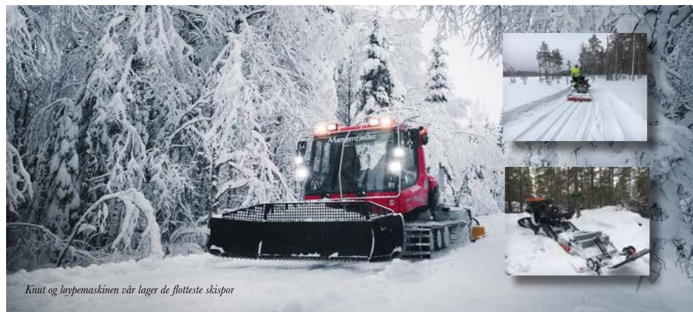
Knut og løypemaskinen vår lager de flotteste skispor

Finn frem et kart og utforsk alle mulighetene. Mangenvassdraget er også et yndet område for kano og kajakk. Mangenfjellet turlag tilrettelegger for utførelse av friluftsliv i Aurskog-Høland kommune både vinter og sommer ved å preparere, merke og skilte skiløyper og sommerstier. Kort og godt folkehelsearbeid på sitt beste – og nesten helt gratis. Vi oppfordrer alle våre brukere til å bli medlem og støtte oss i dette viktige arbeidet.