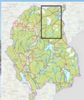
Mangenfjellet – Nord Ost i Aurskog-Høland kommune