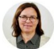
Oppvekststab og pedagogisk tjeneste