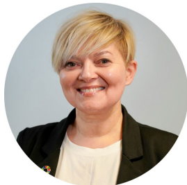
Kommunalsjef Oppvekst og inkludering