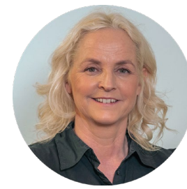
Enhetsleder familie og forebygging

7 skoler/SFO Rømskog Bjørkelangen Aursmoen Løken Bråte Haneborg Setskog Voksenopplæring