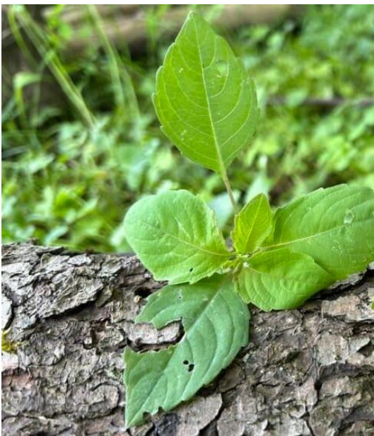
Bildet viser bladene til kjempespringfrø.

Hos Fagus finner du mer informasjon om både planten og hvordan man skal bekjempe den: FAGUS Faktaark Kjempespringfro 2020 .pdf