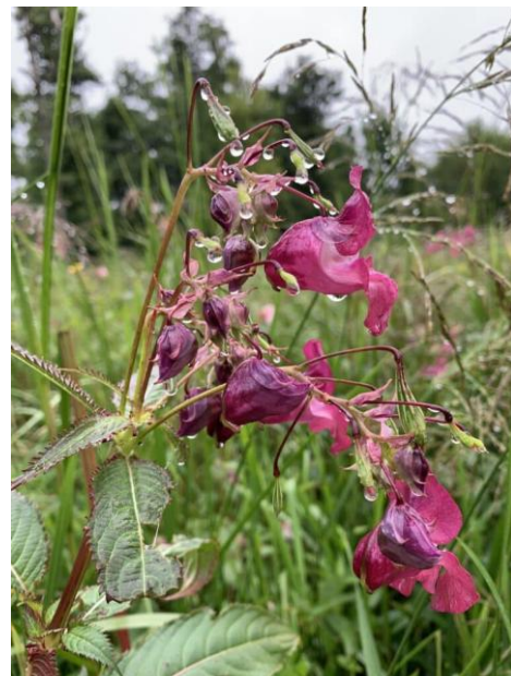
Bildet viser blomst og blader hos kjempespringfrø.