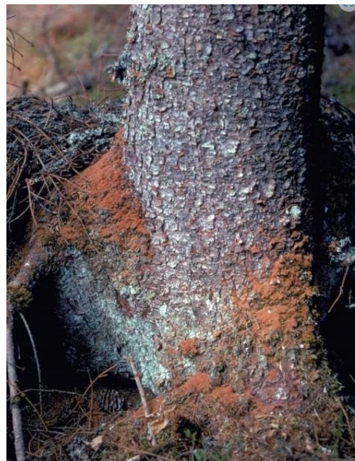
Brunt boremel ved foten av et grantre som er under angrep. Innboringshullene finner du gjerne høyt oppe på stammen.

Mye gran har blitt drept av kombinasjonen tørke og barkebiller på Østlandet de siste årene. Statsforvalteren anbefaler at skogeierne er ute i god tid og følger med skogen sin for å sikre verdier. Billene angriper ofte trær i nærheten av skog som allerede er skadd eller svekket. Les mer om barkebiller og tiltak på hjemmesiden til Statsforvalteren.