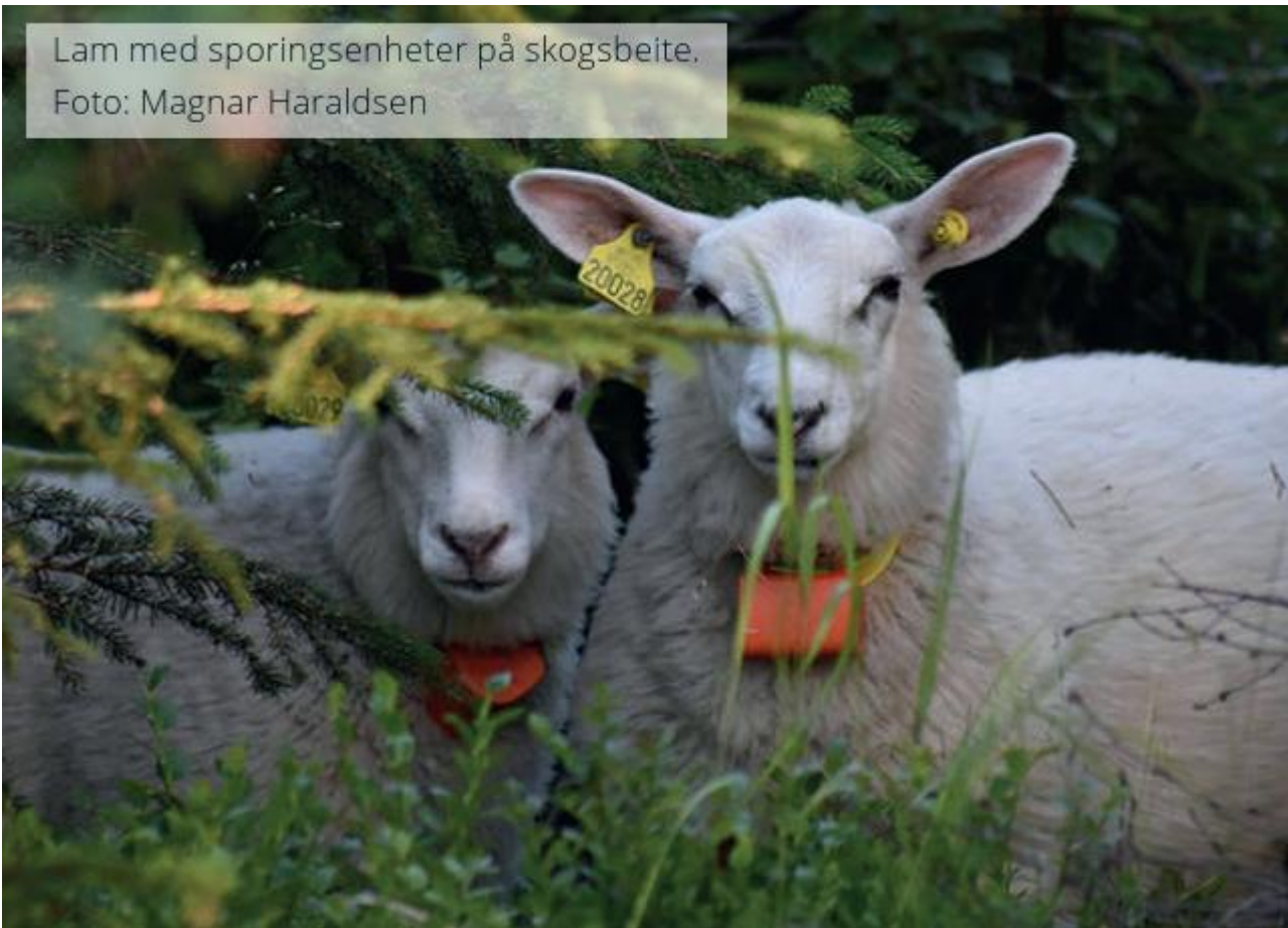
Lam med sporingsenheter på skogsbeite.

Beredskapstelefonnummer for rovvilthendelser i Oslo, Akershus, Østfold og Buskerud: telefon 971 35 265.