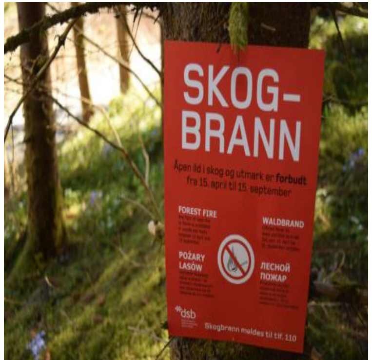
Bålforbudet kan kommuniseres på fem språk.

Grunneiere som ønsker kan laste ned skogbrannplakater her , eller hente plakat på Innbyggertorget på Bjørkelangen.